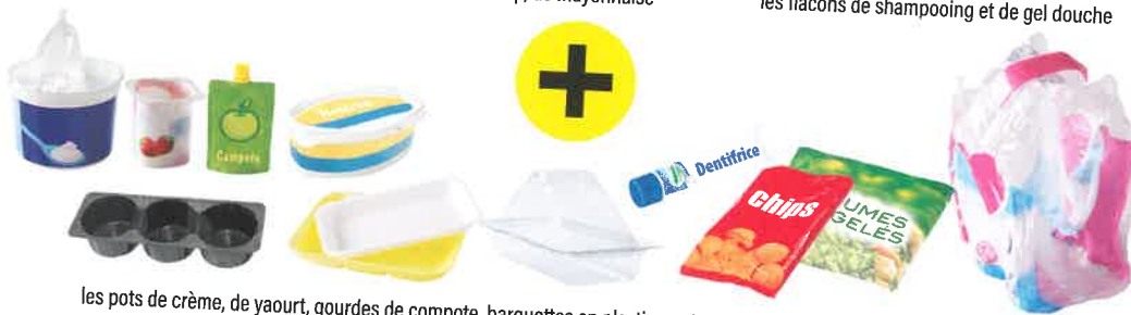
les pots de crème, de yaourt, gourdes de compote, barquettes en plastique et en polystyrène, sachets et films en plastique