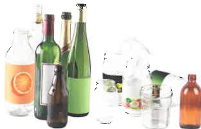
les bouteilles, pots, bocaux et flacons en verre