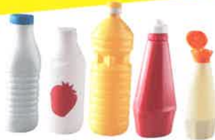
les bouteilles de lait, d'huile, flacons de ketchup, de mayonnaise