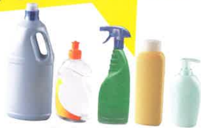
les flacons de produits ménagers les flacons de shampooing et de gel douche