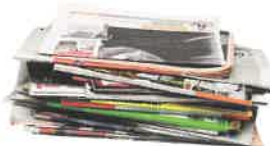
les journaux, magazines