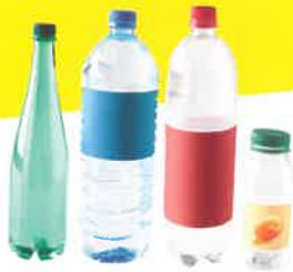
les bouteilles d'eau, de soda, de jus de fruit