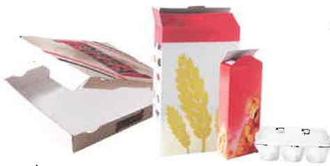
les cartonnettes (boîtes à pizza, paquets de gâteaux, boîtes de céréales, d'œufs...)