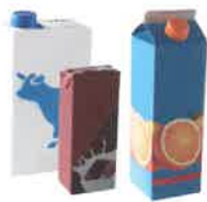
les briques alimentaires