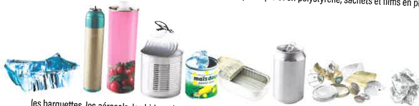
les barquettes, les aérosols, les bidons, les boîtes de conserve, les canettes de boisson, les bouchons et capsules métalliques, le papier aluminium